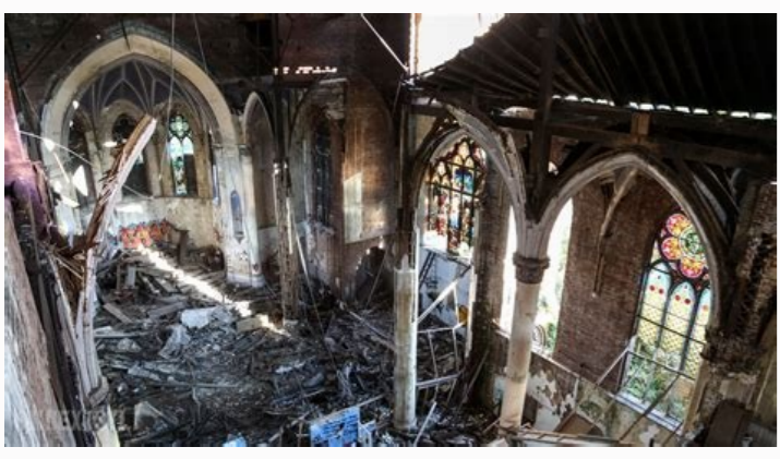
San bernardino catholic church